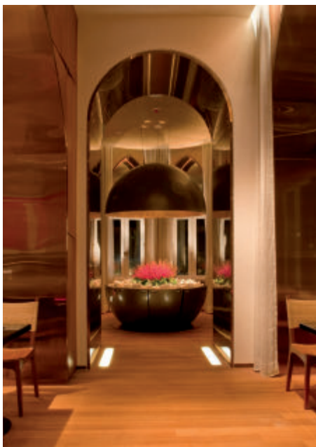
Restaurante Wasabi, Taj Mahal Palace.. Comedor privado abierto y cerrado/Wasabi Restaurant Taj Mahal Palace. Open & Close Private Dining Room

Crear una marca nueva hotelera siempre es un desafío fascinante. Para la nueva marca de Sir