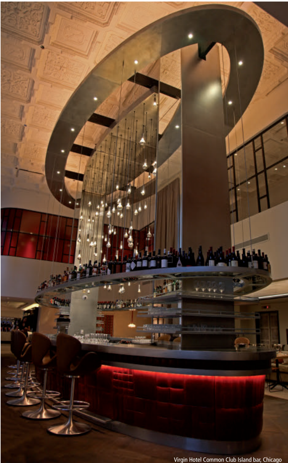
Virgin Hotel Common Club Island bar, Chicago

to create a new experience in a local context without overpowering the local culture.