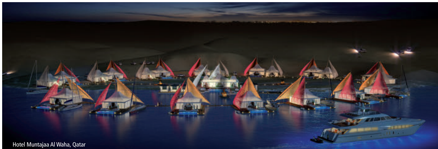
Hotel Muntajaa Al Waha, Qatar

Tres ejemplos de la importancia del producto en la estrategia comercial de cada empresa, y cómo, a partir de un buen producto, se pueden alcanzar metas nuevas donde el diseño es la herramienta aliada. ■