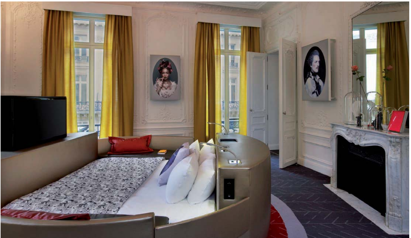
Cama redonda de 3 m 2 que incorpora dos sofás, diseñada y fabricada por Martínez Otero, en la Extreme WOW Suite./ A 3 m 2 round bed which incorporates two sofas, designed and manufactured by Martínez Otero, located in the Extreme WOW Suite.

zas estándar, son muy complejas". Por ejemplo, los cabeceros y el minibar tienen partes de madera tapizada. "La solución de tapizar en madera fue complicada. Se hicieron varias pruebas hasta dar con el adhesivo adecuado, que fuera duradero y los tejidos no se despegaran".