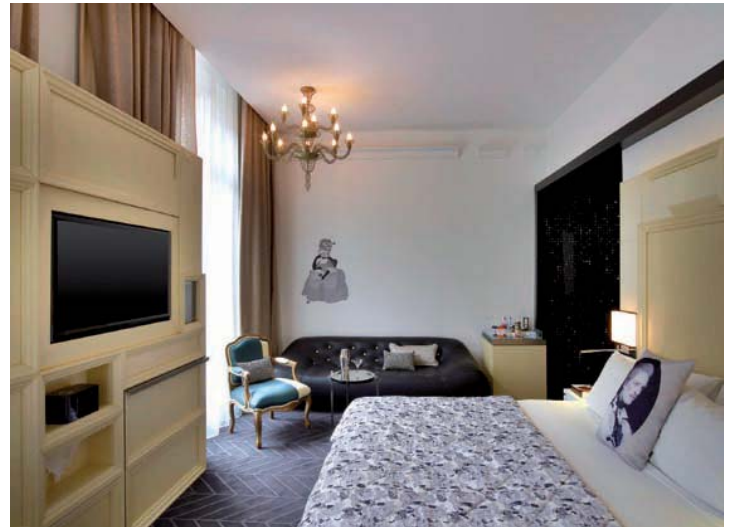
Habitación Fabulous Suite./ The Fabulous Suite.