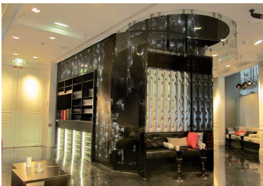
El 'Spark' en toda su extensión, del que emerge un sofá, una bodega o la cabina de DJ. / The 'Spark' in its entirety, from which a sofa, wine-cellar or a DJ's booth might emerge.