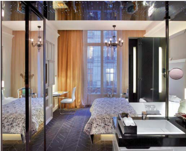
Habitación Wonderful Room./ The Wonderful Room.