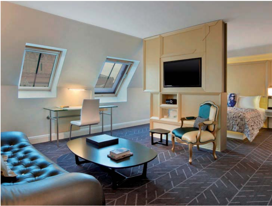
Salón de la Guest Room, con un mueble-TV divisorio anclado al techo. Abajo a la derecha, vistas desde la Guest Room./ Shot of a living room in a Guest Room, with a TV furniture piece partition anchored to the ceiling. Bottom right, views from the Guest Room.

EMPRESAS ESPAÑOLAS PROVEEDORAS DE EQUIPAMIENTO/SPANISH COMPANIES SUPPLYING EQUIPMENT: Mobiliario en habitaciones/Furniture in the rooms: Martínez Otero Mobiliario del restaurante/Restaurant Furniture: Andreu World Alfombras/Carpetry: Alarwool Textiles/Textiles: Pyton, Gancedo, Viriato Iluminación/Lighting: Lutron Grifería/Faucets: Hansgrohe Metales/Metal: Rimex