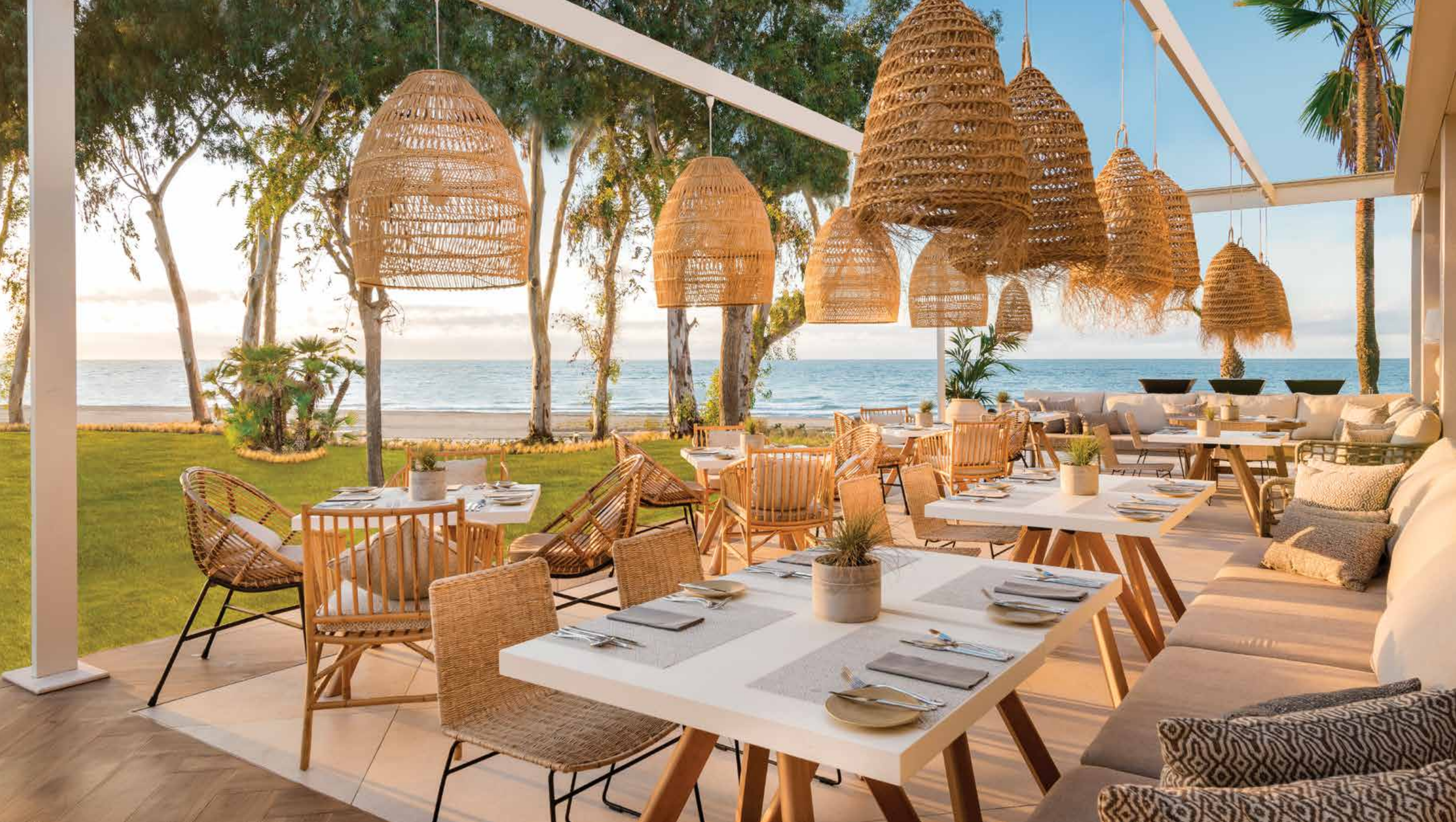
Beach Club rounds out the gastronomic options with an informal and ethnic restaurant offering views of the sports area and the beach. Highlights include its natural textiles, including large hanging lights.