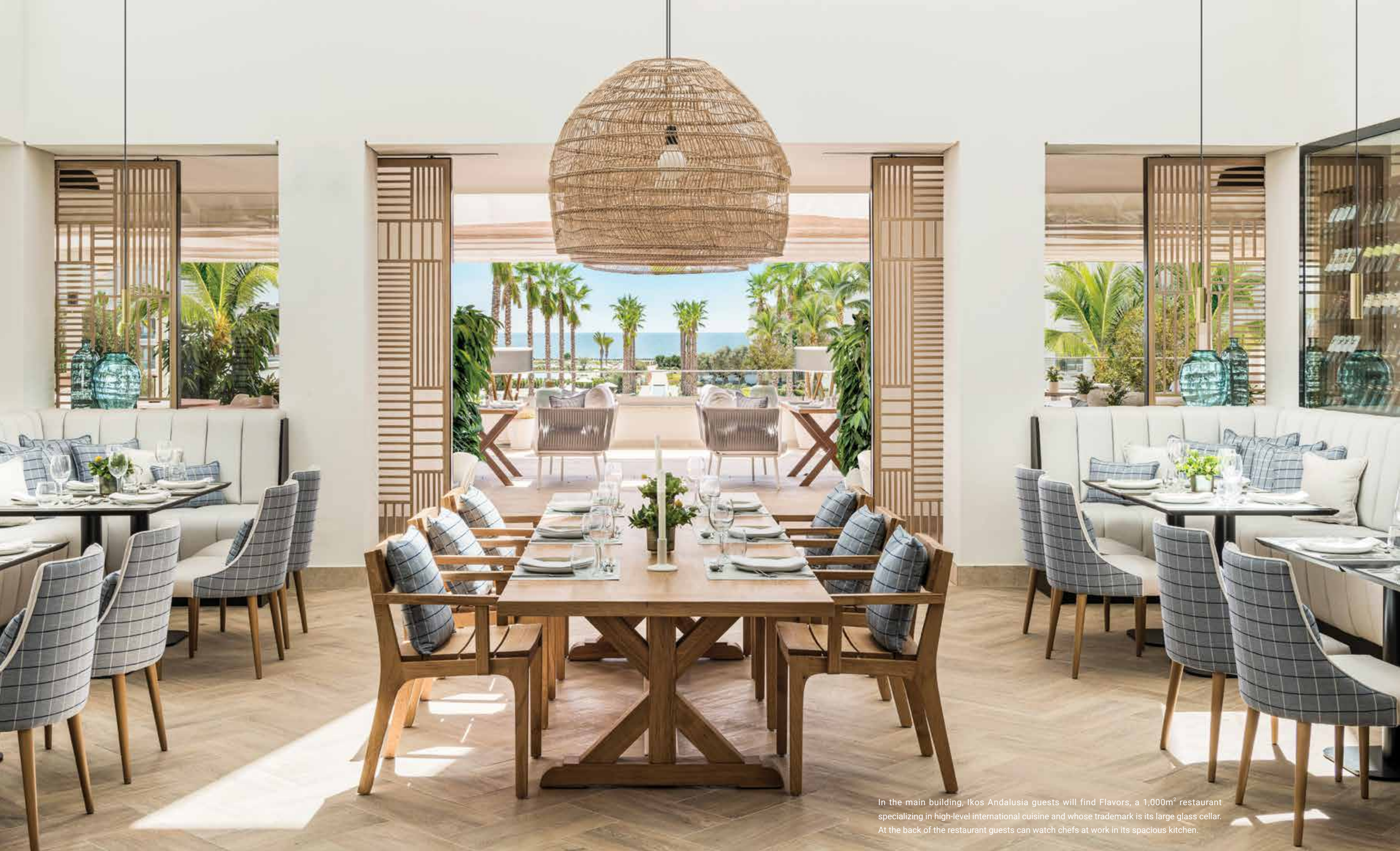
In the main building, Ikos Andalusia guests will find Flavors, a 1,000m 2 restaurant specializing in high-level international cuisine and whose trademark is its large glass cellar. At the back of the restaurant guests can watch chefs at work in its spacious kitchen.