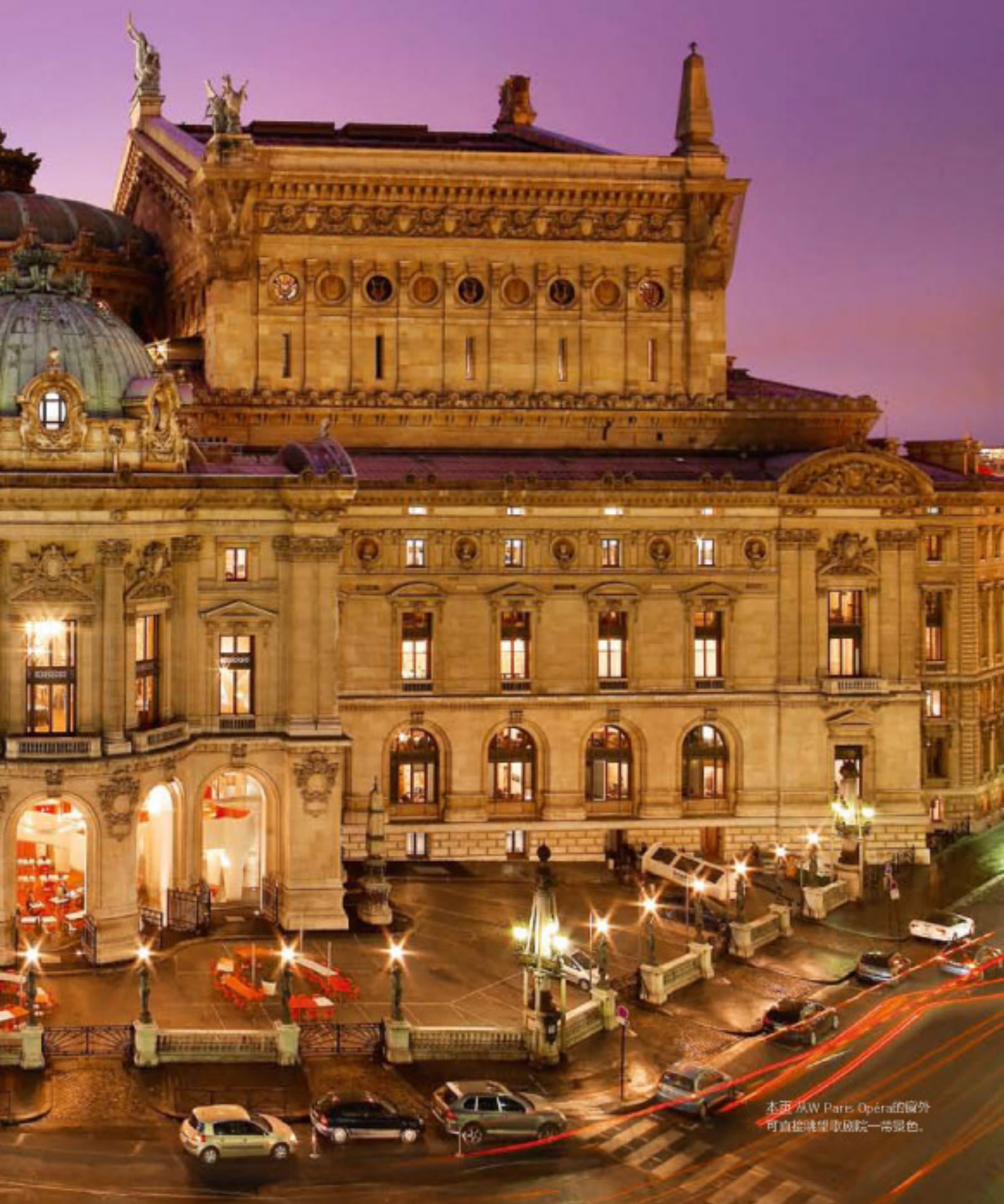
本頁 从W Paris Opéra的窗外 可直接眺望歌劇院一帶景色。